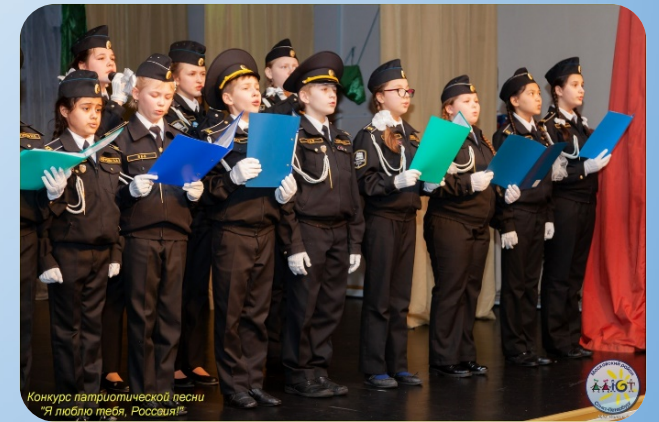
Конкурс патриотической песни "Я люблю тебя, Россия!"